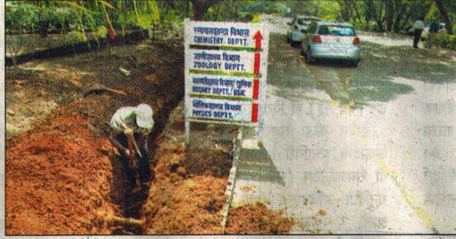
कोल्हापूर : वायफायची लाईन टाकण्यासाठी खुदाई करताना कर्मचारी.

तंत्रज्ञानाच्या युगात देशभरातील सर्वच विद्यापीठ व महाविद्यालये वायफाय युक्त झाली आहेत. शिवाजी विद्यापीठाने जिओ रिलायन्सबरोबर सामंजस्य करार करून विद्यापीठातील विद्यार्थ्यांना माफक दरात जिओची वाय-फाय सुविधा उपलब्ध करून देण्याचा निर्णय घेतला आहे. या करारांतर्गत १० ते ५० एमबी इंटरनेट निः शुल्क देणार आहे. त्यानंतर जेवढे